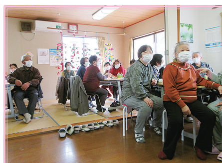
黄金区 お茶っこ飲み会