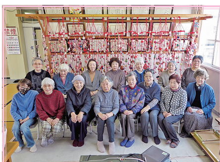
9の2区 高砂会婦人部