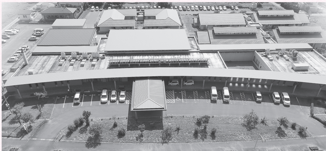
ゆうらいふ施設全景

介護サービス事業においては、利用者が住み慣れた家、地域で暮らすことができるよう、広く町民の介護ニーズに応え、質の高いサービスの提供、利用促進に努め、地域に根差した社協らしい介護サービスの提供に取り組んでいきます。