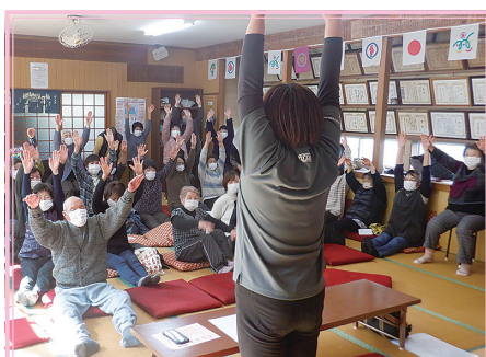
猪岡区 福祉と健康に関する講座