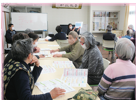
1区 お茶っこ飲み会

新年度を迎え、地域でも様々な活動が動き出しています。今年度も、たくさんの良いところ発見のため地域へお伺いし、情報を発信していきますので、ぜひ「こんなことやるよ～」とお声がけください。