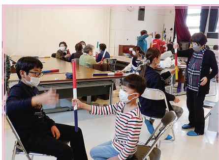
太田区 いきいき交流会