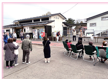
涌谷駅周辺を明るくする会