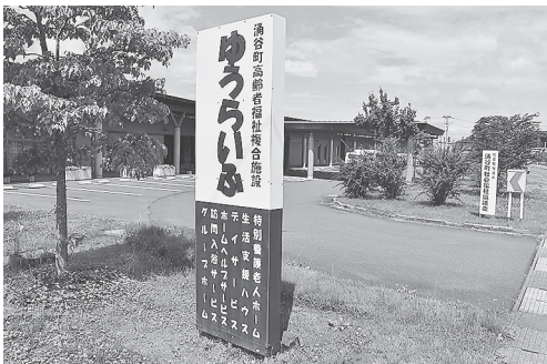
涌谷町高齢者福祉複合施設ゆうらいふ ☎43-6661