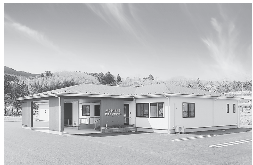
ゆうらいふ麓岳地域ケアセンター ☎25-5596

「どのようなサービスを利用できるんだろう」「要介護認定を受けたけど、どこに連絡すればいいかわからない」など、介護に関する悩みやゆうらいふの介護サービスに関することは、お気軽にご相談ください。