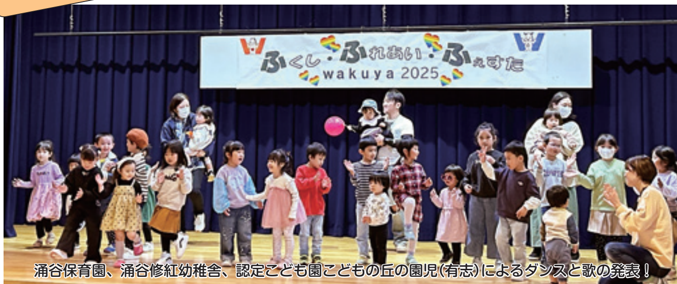
涌谷保育園、涌谷修紅幼稚園、認定こども園こどもの丘の園児(有志)によるダンスと歌の発表!