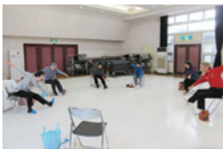
太田区 運動ひろば