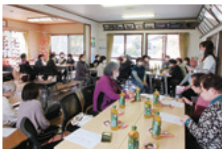
黄金区 ひな祭り会