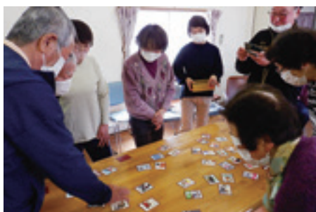
2の3区 お茶っこ飲み会