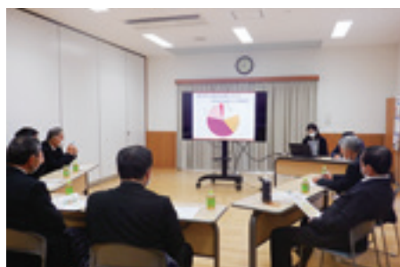
仙北富士交通株式会社 認知症サポーター養成講座