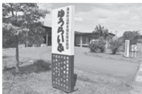
涌谷町高齢者福祉複合施設ゆうらいふ