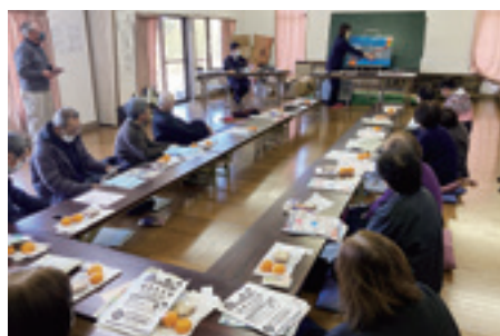
上郡2区 シルバー安全安心教室