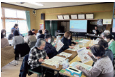
岸ヶ森区 健康・福祉 役員引継ぎ会