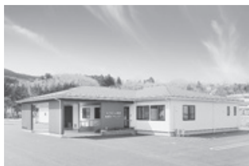
ゆうらいふ麓岳地域ケアセンター